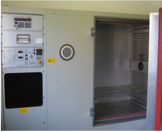
Slika 2. Detalj iz ispitne laboratorije CENAD (klima komora VLK 04/1000, Heraeus- Vötsch)