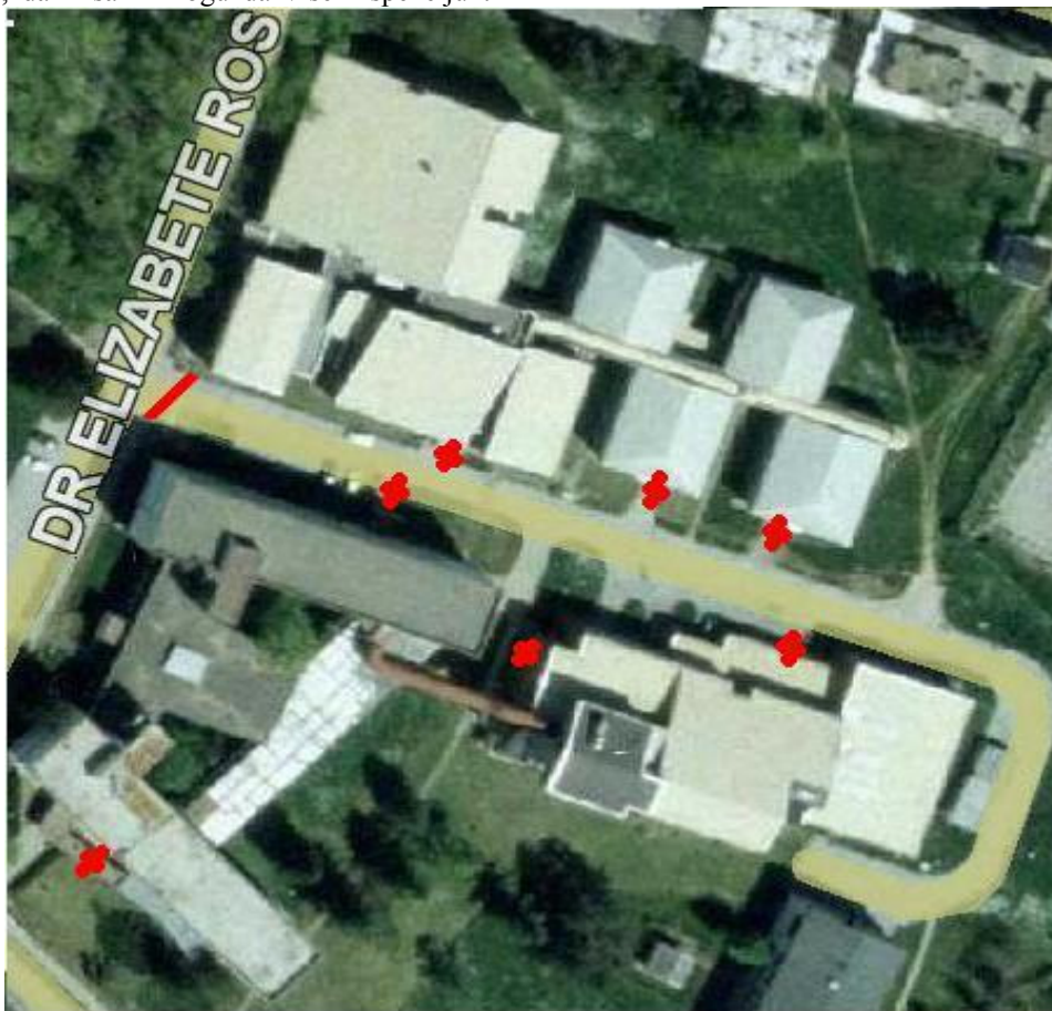
Slika 2 - Glavni ulazi Mašinskog fakulteta

sistema i ispravljaju svoje aktivnosti. Praksa sprovođenja takvih odluka bi bila nepraktična u nekim situacijama zbog kompleksnosti ovakvog sistema. Sa RFID tehnologijom je moguće obraditi sve aspekte prikupljanja podataka i proučiti individualno ponašanje svih na fakultetu.