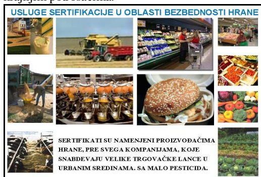
Slika 2. Zahtevi za pravilnu i kvalitetnu ishranu

Pravilno skladištenje i transport trebaju osigurati kvalitetu i zdravstvenu ispravnost hrane tijekom cijelog distribucijskog lanca – od proizvođača hrane, preko transporta i skladištenja do isporuke hrane trgovačkim lancima, hotelima, restoranima i krajnjim potrošačima.