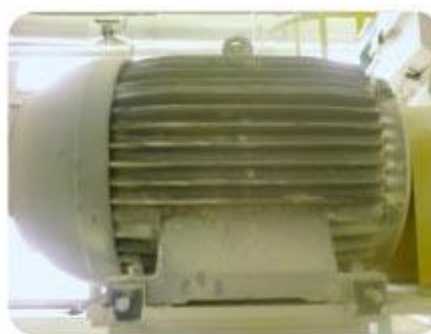
Termovizijska slika elektromotora na Medijani 2