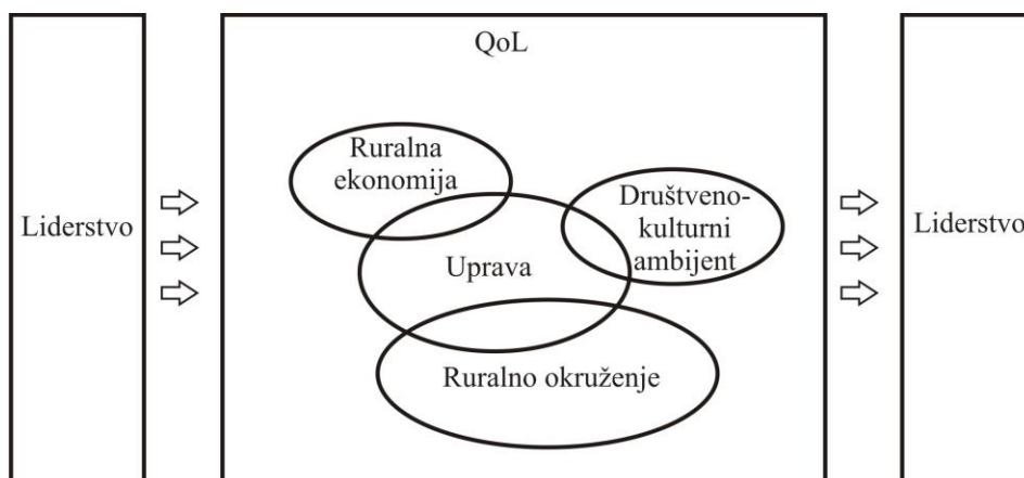
Sl. 1 Liderstvo i QoL u ruralnim sredinama

Prema programu za razvoj ruralnih sredina, prema EC No. 1698/2005 utvrđeni su sledeći ciljevi: