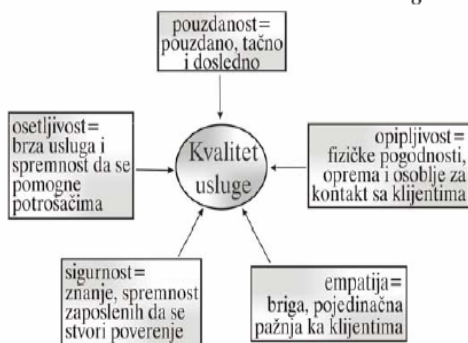
Slika 2 – Redukovane determinante kvaliteta usluge