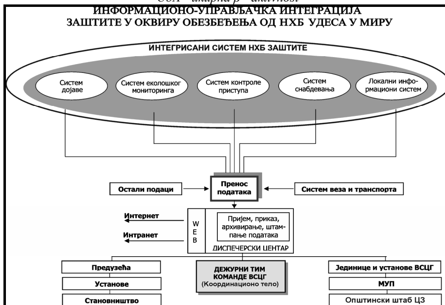
Slika 4 - Informacioni sistem u funkciji NHB zaštite