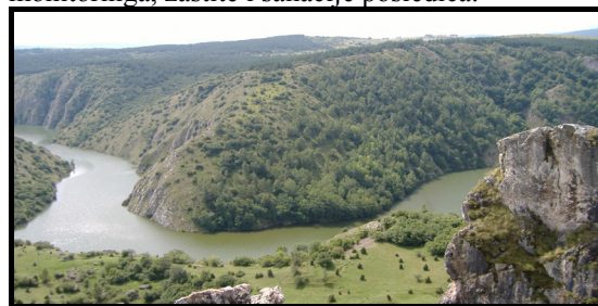
Slika 1 - Čudesni rezervati vode u Srbiji

U ovom radu izvršena je analiza i kontrola uzoraka vode u laboratorijskoj stanici ABHO, osloncem na kapacitete teritorije i preduzeća. Zatim je usledilo određivanje radioaktivnosti vode za piće, gde je u vreme agresije NATO-a palo na hiljade avio i raketnih projektila različitog kalibra, fizičko-hemijskog sastava i razorne moći. Ispitivanje je izvršeno radi praćenja posledica degradacije vodnih resursa i preduzimanja mera monitoringa, zaštite i sanacije posledica.